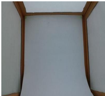
Gambar 1a & 1b Light box untuk pemotretan produk