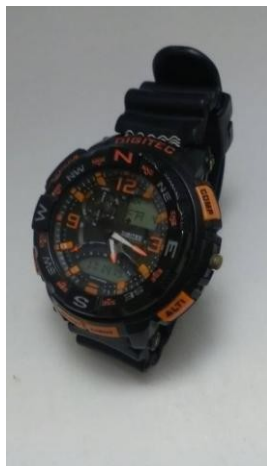
Gambar 4a Foto karya salah satu peserta sebelum pemberian materi

untuk melihat bentuk produk yang akan dibeli. Foto produk berupa file yang bisa dibuat dengan bantuan kamera digital (dalam Munir, Saroh, & Krisdianto, 2019:178). Contoh di bawah ini menunjukkan hasil foto “sebelum” (foto 3a) dan “sesudah” (foto 3b) mendapatkan pengetahuan singkat untuk aplikasi fotografi praktis.