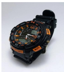
Gambar 4b Foto karya salah satu peserta setelah pemberian materi

Setelah penyuluhan, peserta mendapati bahwa memotret produk itu