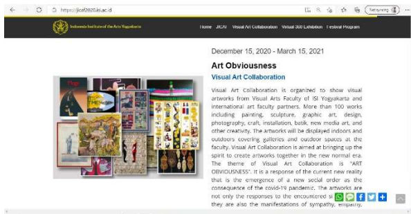
Gambar 3. Tampilan pada setiap rangkaian acara