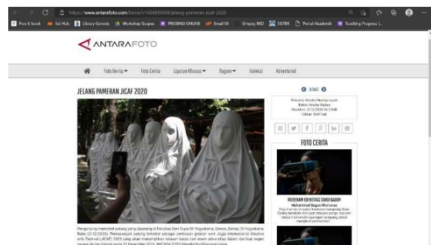
Gambar 1. Liputan Media Antara

Terdapat empat rangkaian acara yang terintegrasi diantaranya adalah Visual Art Collaboration , Visual Art Workshop , Creative Sharing Forum , dan Visual Art Competition (Gambar 3). Visual Art Collaboration merupakan salah satu rangkaian acara yang paling panjang prosesnya yakni berupa pameran karya yang menjadi kegiatan pamungkas dari festival JICAF.