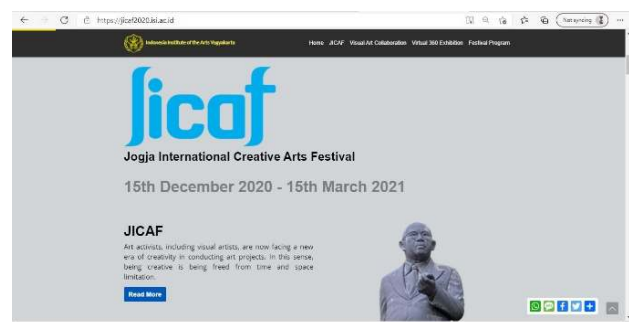
Gambar 2. Tampilan Depan Website JICAF