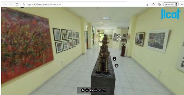
Gambar 4. Ruang Pamer Festival Seni Virtual JICAF