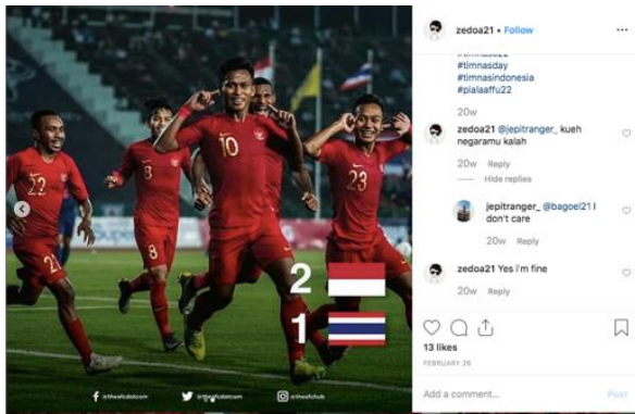
Gambar 2 Foto 2