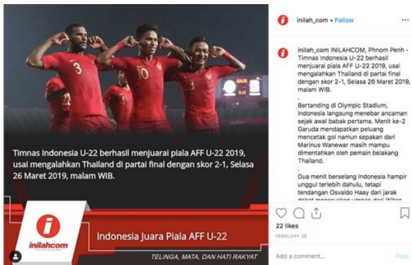
Gambar 3 Foto 3 diunggah oleh akun @Inilah_com