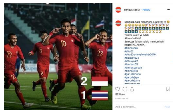
Gambar 6 Foto 6 diunggah oleh akun @serigala.bola