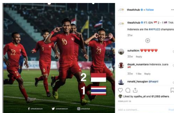
Gambar 1 Foto 1 diunggah oleh akun @theafchub

Pada pertandingan final Piala AFFU22. Pasca mencetak gol, pada menit 63, Osvaldo Haay betul-betul memanfaatkan dirinya di depan lensa. Ia bukan sekadar melakukan selebrasi, namun juga memberikan pesan ideologis terhadap jutaan pasang mata, sekaligus federasi, juga kepada lawan bermainnya. Beberapa visual yang muncul di media sosial media instagram di unggah oleh beberapa akun, yakni @theafchub, @zedoa21, @serigala.bola, @bolanet, @inilah_com, @suaragratiatfm, @antarafotocom, @officialnewstv. Unggahan-unggahan tersebut menampilkan foto Osvaldo Haay pasca mencetak gol kedua Timnas Indonesia. Banyak unggahan dari laman berita yang kemudian diambil dan diunggah ulang oleh pengguna Instagram tanpa mencantumkan sumber. Foto-foto perayaan tersebut tidak sekadar menampilkan visual foto saja, namun sudah mengalami modifikasi, ada yang berupa visual dengan disertai tekstual maupun dengan visual yang lain. Kecuali satu foto yang diunggah oleh @antarafotocom, namun foto tersebut diunggah ulang oleh akun @officialnewstv dengan disertai teks.