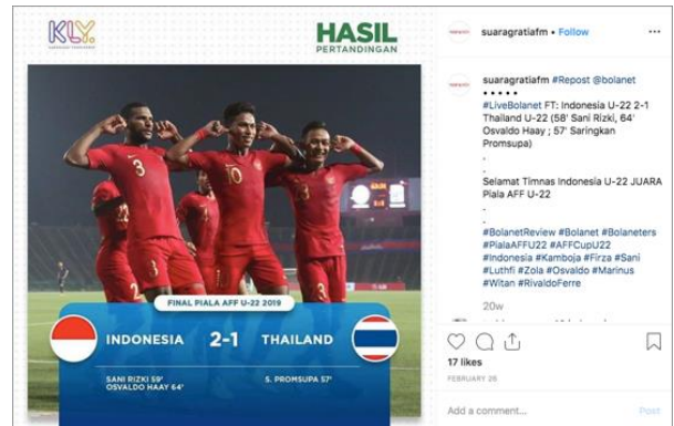
Gambar 5 Foto 5 diunggah oleh akun @suaragratiadm