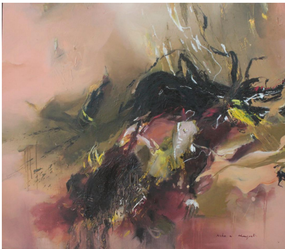
Gambar 1. Ruang Tanpa Sudut _115 x135 cm_2019

Dalam karya pertama ini, pencipta menggunakan media cat akrilik, krayon, spidol di atas kanvas. Karya abstrak ekspresionis ini tidak menunjukkan bentuk secara jelas dan gamblang, namun objek dalam karya ini sebenarnya adalah abstraksi bentuk dari tubuh manusia yang tersungkur. Di sini pencipta menggunakan warna dominan krem, hitam, dan campuran kuning dengan hitam sebagai ekspresi pemikiran yang terfokus pada tubuh yang lemah, kecewa pada keadaan, dan kerumitan perasaan yang disembunyikan selama ini dan diungkapkan dengan bebas di atas kanvas. Pencipta melakukan recalling memorinya tentang situasi genting di suatu ruangan dan menghadapi kenyataan tentang tubuh yang setengah lumpuh sendirian. Sebuah roda, sedikit matahari, aku masih hidup sebagai tanda syukur. Sore itu ditemani roda gerobak sebagai ganti kursi roda yang cukup mahal. Ingatan sangat kuat dengan situasi di ruangan lembab, basah dengan badan berlumur kotoran serta sedikit matahari yang sampai ke atas permukaan kulit.