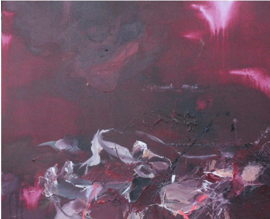
Gambar 2. Pamit di Bagian Tubuhnya_110 x90 cm_2019

Sama seperti karya pertama, dalam karya kedua ini pencipta menggunakan media cat akrilik, krayon, spidol di atas kanvas. Di sini pencipta masih melakukan recalling memori, yang menyaksikan kematian orang dekat dan mendengar orang itu memanggil namanya sesaat sebelum meninggal. Memori kematian yang penuh darah, keluar dari beberapa bagian tubuhnya. Ingatan kehilangan yang benar-benar berbeda dari biasanya dan meninggalkan bekas memori tersendiri yang masih teringat sampai sekarang.