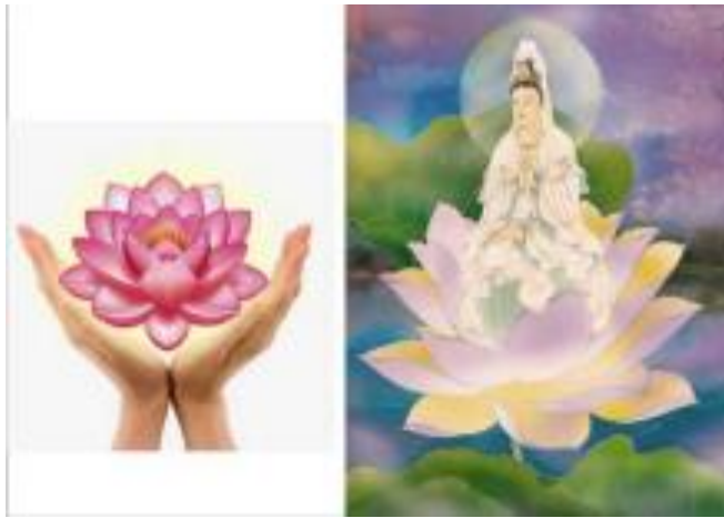
Figure 5. Referensi karya dengan tema bunga teratai dan doa.

qunut ditambahkan untuk memperkuat gagasan doa pada karya ini. Tulisan arab divisualkan seperti tulisan cina agar tetap selaras dengan latar belakang yang sudah dibuat.