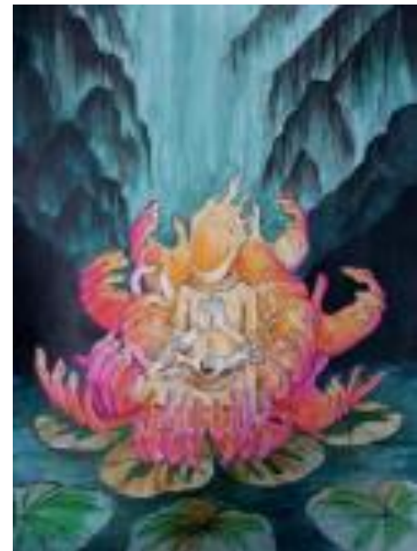
Figure 8. Karya jadi sebelum tahap digital

Prinsip in and through terjadi saat pembuatan sketsa dan eksekusi akhir karya. Karya ini menggunakan medium tinta akrilik dan tinta cina di atas kertas Montval berukuran 75 x 95 cm. Ketika keseluruhan karya sudah 80% selesai, terjadi pertimbangan artistik lain. Latar belakang terasa kosong, oleh sebab itu, tahap berikutnya adalah digitalisasi. Proses digitalisasi dilakukan untuk memberikan tambahan visual di dalamnya. Font huruf arab bertuliskan doa