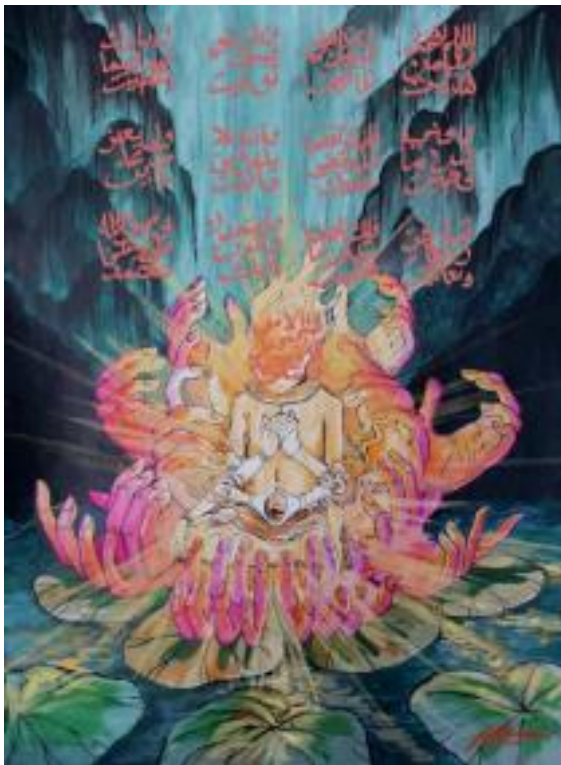
Figure 10. Karya akhir. Sumber: dokumen pribadi)

Masih pada prinsip in and through , pengembangan karya digital berlanjut menjadi wallpaper ponsel dengan pertimbangan fungsi mandala. Mandala berfungsi sebagai media spiritual. Sama halnya dengan karya ini, gawai dan wallpaper di dalamnya dimaknai ulang sebagai media spiritual di era saat