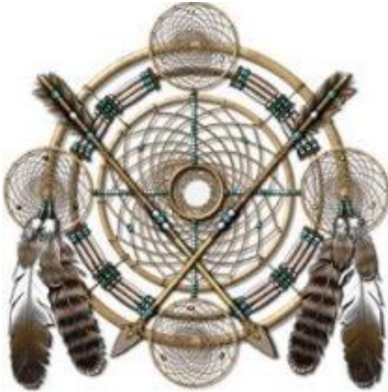
Figure 3. Native American dreamcatcher.

batu mulia, dan manik-manik dimana kesemuanya memiliki filosofgi tertentu.