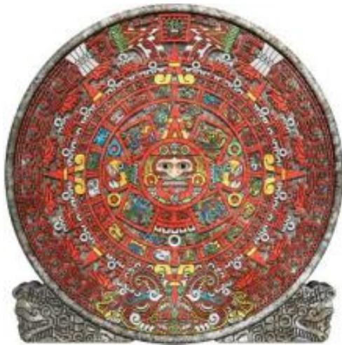
Figure 4. Mayan Calendar.