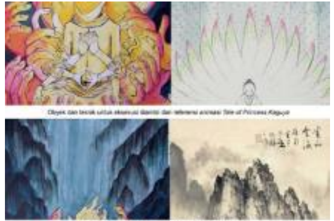
Figure 7. Implementasi referensi menjadi karya.

qunut ditambahkan untuk memperkuat gagasan doa pada karya ini. Tulisan arab divisualkan seperti tulisan cina agar tetap selaras dengan latar belakang yang sudah dibuat.