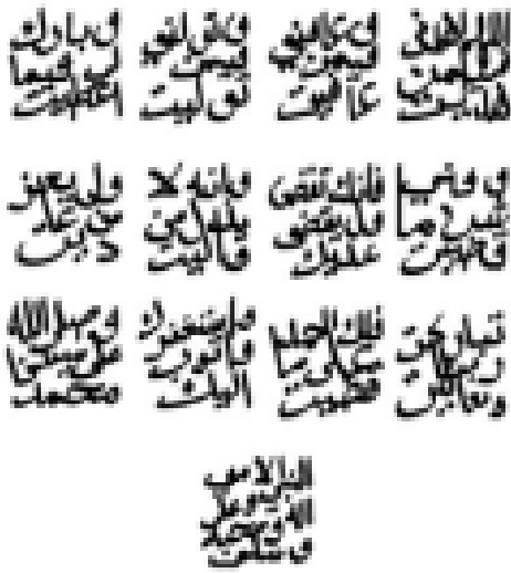
Figure 9. Konfigurasi tulisan arab doa qunut