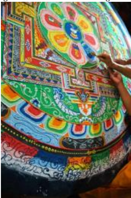
Figure 1. Tibetan Sand Painting Mandala,

(Sumber: https://id.pinterest.com/pin/2251868543697895/ )