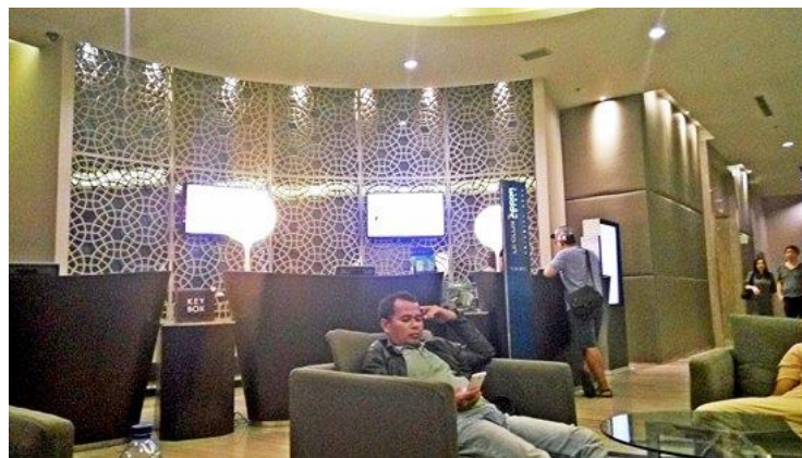
Gambar 6 Area resepsionis pada lobby Novotel Jakarta Gajah Mada

Pada area backdrop resepsionis terlihat penggunaan panel dengan ornamen atau motif lingkaran berulang yang berwarna putih (gambar 6). Penggunaan motif lingkaran sendiri merupakan ciri karakter desain interior modern. Penggunaan motif lingkaran yang berulang pada backdrop menjadi salah satu elemen yang ditonjolkan pada area ini.