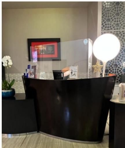
Gambar 10 Meja resepsionis pada lobby Novotel Jakarta Gajah Mada

Penggunaan furnitur pada lobby pun tidak dibuat dengan aksent tertentu, namun tetap dibuat menonjol dengan memberikan sentuhan warna alami kayu. Pada meja resepsionis menggunakan warna hitam, yang digunakan sebagai aksent yang menonjol. Penggunaan ukiran atau detail umumnya jarang ditemukan pada furnitur kontemporer, sehingga meja resepsionis pada lobby hotel ini menerapkan ciri khas gaya kontemporer dan mencirikan kesederhanaan dan fungsionalitas sesuai dengan filosofi Novotel yaitu desain yang fungsionalitas.