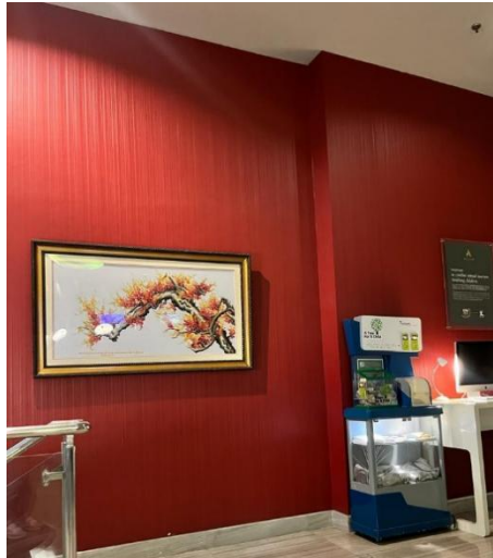
Gambar 7 Area dinding dengan warna merah

Sebagai elemen dekorasi ditempelkan beberapa lukisan pada beberapa sisi dinding. Selain pada lobby banyak ditemukan lukisan abstrak pada hotel ini, yang menjadikan lukisan ini merupakan ciri khas dari hotel tersebut. Selain lukisan, terdapat juga patung sebagai sentuhan seni modern pada area lobby hotel. Lukisan dan patung sendiri merupakan ciri khas kontemporer yaitu desain interior kontemporer mencakup seni modern sebagai bagian integral dari dekorasi. Patung pada area lobby ini diletakkan ditengah-tengah dekat kolom besar yang berwarna abu dengan ukiran garis garis lengkung yang dinamis dan pencahayaan pada area ceiling kolom yang menjadikannya sebagai aksent yang ikut ditonjolkan, hal tersebut merupakan salah satu ciri pencahayaan pada desain interior kontemporer yaitu pencahayaan biasanya digunakan untuk fokus pada elemen atau dinding aksent dan karya seni (Julianto, 2018), Penggunaan pencahayaan tersebut juga memberikan pengalaman estetis kepada para tamu, termasuk para pelaku bisnis yang menginap di hotel ini.