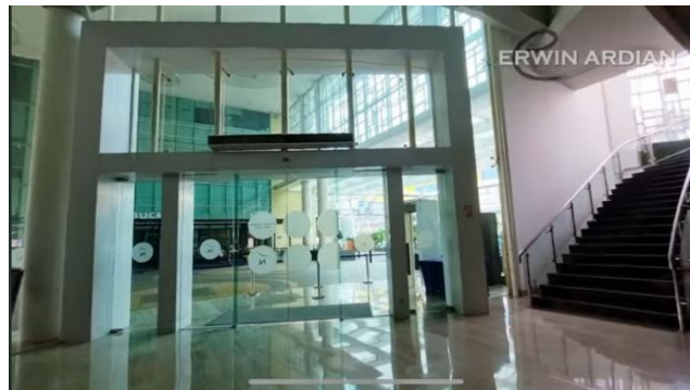
Gambar 5 Penggunaan pencahayaan alami pada lobby Novotel Jakarta Gajah Mada

Pada area backdrop resepsionis terlihat penggunaan panel dengan ornamen atau motif lingkaran berulang yang berwarna putih (gambar 6). Penggunaan motif lingkaran sendiri merupakan ciri karakter desain interior modern. Penggunaan motif lingkaran yang berulang pada backdrop menjadi salah satu elemen yang ditonjolkan pada area ini.