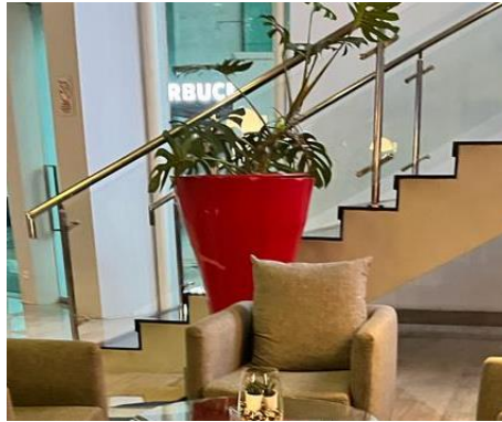
Gambar 9 Tanaman hijau sebagai ciri khas kontemporer yang menambah kesan homey pada lobby Novotel Jakarta Gajah Mada

Penggunaan furnitur pada lobby pun tidak dibuat dengan aksent tertentu, namun tetap dibuat menonjol dengan memberikan sentuhan warna alami kayu. Pada meja resepsionis menggunakan warna hitam, yang digunakan sebagai aksent yang menonjol. Penggunaan ukiran atau detail umumnya jarang ditemukan pada furnitur kontemporer, sehingga meja resepsionis pada lobby hotel ini menerapkan ciri khas gaya kontemporer dan mencirikan kesederhanaan dan fungsionalitas sesuai dengan filosofi Novotel yaitu desain yang fungsionalitas.