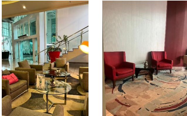
Gambar 3 Seating Group pada lobby Hotel Novotel Jakarta Gajah Mada

Perancangan layout pada lobby hotel ini dibuat dengan konsep terbuka atau open-space , sehingga tidak ada pembatas ruangan maupun partisi, Desain ini membangun suasana yang lebih luas, nyaman, dan mencairkan antara karyawan. Konsep terbuka ini tidak hanya menciptakan atmosfer yang ramah, tetapi juga memfasilitasi interaksi antara tamu dan menciptakan suasana yang bersahabat. Ruang terbuka memberikan fleksibilitas bagi para tamu untuk bergerak dengan leluasa, baik saat berbicara bisnis, bersantai, maupun beraktivitas bersama keluarga.