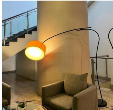
Gambar 11 Penggunaan standing lamp pada area lobby Novotel Jakarta Gajah Mada

Pencahayaan yang digunakan pada lobby ini berupa pencahayaan alami dan pencahayaan buatan. Untuk pencahayaan alami berasal dari bukaan ruang berupa jendela yang besar sehingga pada siang hari area ini tidak terlalu banyak menggunakan pencahayaan buatan. Pencahayaan buatan di area ini menggunakan downlight , standing lamp , dan LED strip . Penggunaan standing lamp pada area ini yang menggunakan material stainless steel berwarna hitam, menjadi salah satu aksesoris yang ditonjolkan sebagai ciri khas penggunaan material pada desain interior kontemporer dan merupakan salah satu ciri khas penggunaan pencahayaan paling populer pada desain interior kontemporer. Pencahayaan yang digunakan menggunakan warna warm white yang membuat kesan ruangan hangat dan nyaman. Secara keseluruhan, pencahayaan di lobby ini mencerminkan filosofi Novotel yang menekankan desain fungsionalitas, dan pengalaman intuitif dan juga membuat suasana yang nyaman dan efisien bagi para tamu, termasuk para pelaku bisnis yang mencari keseimbangan antara bekerja, bersantai, dan menghabiskan waktu bersama keluarga selama menginap di hotel.