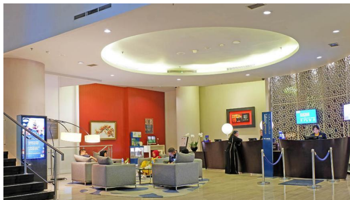
Gambar 4 Lobby Novotel Jakarta Gajah Mada (Sumber: Leonard, 2023)

Dengan demikian, lobby yang tidak memiliki pembatas ruangan menggambarkan suasana yang lebih santai, sejalan dengan prinsip-prinsip Novotel yang menekankan pada pengalaman intuitif dan berganti aktivitas dengan lancar. Hal ini tidak hanya memenuhi kebutuhan para pelaku bisnis yang menginginkan tempat yang dinamis dan efisien untuk bekerja, tetapi juga memberikan suasana bagi tamu yang ingin bersantai dan berkumpul bersama keluarga.