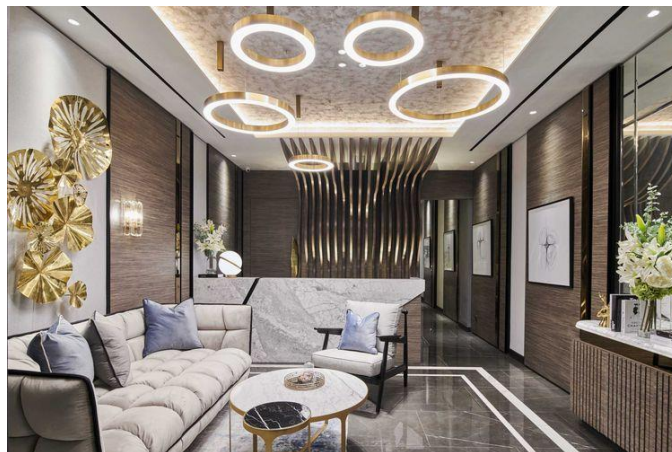
Gambar 1 Contoh gaya modern kontemporer pada ruang tamu (Sumber: Kompas.com, 2022)

Gaya desain interior modern kontemporer, yang sedang populer saat ini, memiliki ciri khas garis lurus pada detail furnitur, pegangan tangga, dan dekorasi. Penataan ruang yang efisien dan fungsional, penggunaan material alami, serta adaptasi ke iklim tropis Indonesia pada bangunan menjadi poin penting. Selain itu, pencahayaan yang tepat dengan lampu berjumlah dan berwarna putih menciptakan kesan modern dan spesifik. Secara ringkas, desain ini menonjolkan kesederhanaan, fokus pada fungsi, penggunaan bahan alami, dan mengikuti tren masa kini dengan sentuhan seni modern.