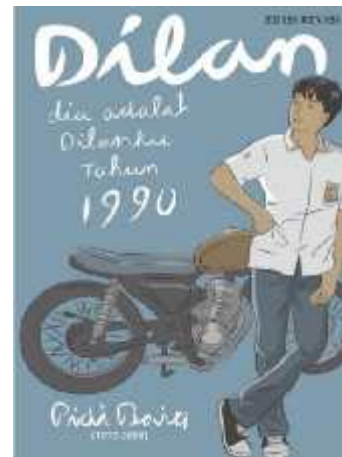
Gambar 1 sampul novel “DILAN: Dia adalah Dilanku tahun 1990”