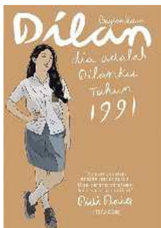
Gambar 2 sampul novel “DILAN: Dia adalah Dilanku tahun 1991”