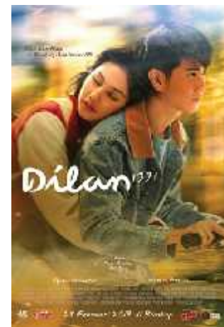
Gambar 4 poster film “Dilan 1991”