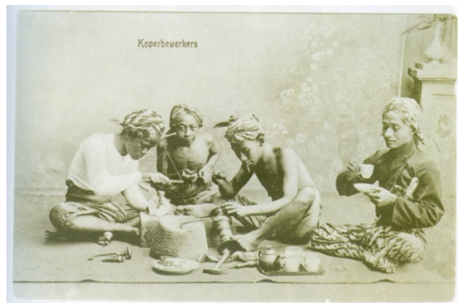
Gambar 3 Foto sampel 3, “Perajin Kuningan”.

etnografi. Secara judul menunjukkan jika peristiwa merupakan hal sederhana yang biasa terjadi di masyarakat Jawa (pribumi) sehari-hari. Pemakaian properti asli yang dibawa masuk ke studio menambah sisi alami visual foto. Kualiti gerabah, bakul ( wakul ) anyaman bambu, dan daun pisang sebagai piring maupun sendok daun, ditata seperti penjual sarapan yang menggelar dagangan dan melayani pembeli. Kesan alami diperkuat oleh atribut pakaian subjek foto. Semua subjek manusia mengenakan pakaian khas masyarakat Jawa pada masa tersebut. Perempuan dengan kebaya serta laki-laki dengan kain yang digunakan sebagai semacam celana serta ikat penutup kepala. Jenis pakaian pada foto ini, celana pendek dan sarung-kain selongsong yang dililitkan di pinggang dan panjangnya mencapai mata kaki, biasa dikenakan oleh lelaki di kalangan rakyat jelata, khususnya di pedesaan. Begitu pula penutup kepala semacam ikat kepala atau blangkon , merupakan ciri khas lelaki Jawa yang bertahan dari akulturasi pada masa tersebut (Lombard, 2008:158).