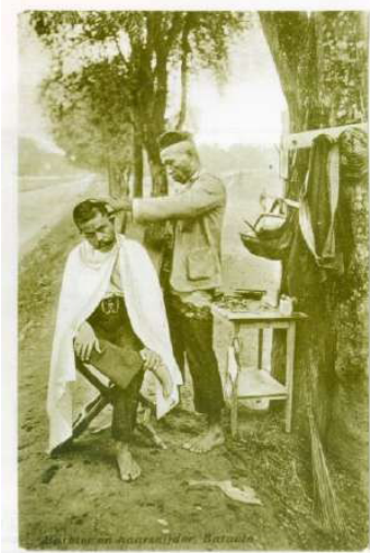
Gambar 4. Foto sampel “Tukang Potong Rambut”.

alih medium serta usia artefak yang sudah tua sehingga menimbulkan efek-efek tersebut. Kecenderungan piktorialisme juga samar teras. Kabut yang menjadi latar belakang foto menambah kesan “lembut” pada foto. Tidak tercantum nama fotografer namun penerbit adalah Kolff & Co, Batavia. Lokasi pemotretan di bawah pohon pinggir jalan di suatu wilayah Batavia. Tukang potong rambut membuka salon di bawah pohon. Meja dan perlengkapan cukur tertata di atasnya. Selain itu kapstok dan kaca dipaku pada batang pohon, serta tas tangan.