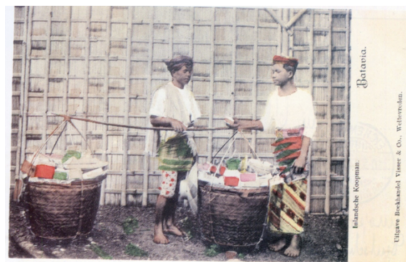
Gambar 1. Kartu pos berwarna "Inlandsche Koopman/Pedagang Pribumi". Pewarnaan pada kartu pos lama masih dilakukan secara manual menggunakan kuas lukis.

Salah seorang kolektor kartu pos lama, Olivier Johannes Raap mengumpulkan kartu pos bertema Indonesia dari berbagai sumber. Meskipun berkebangsaan Belanda, hobinya mempelajari sejarah menjadikan koleksi kartu posnya dilengkapi keterangan terkait dengan subjek foto pada kartu pos yang sudah dibukukan dalam beberapa jilid. Salah satunya berjudul "Pekerja di Djawa Tempo Doeloe" (2013). Pada buku ini dapat ditemukan lebih dari 176 koleksi kartu pos lama, baik dengan imaji visual maupun hanya tulisan. Sesuai judul buku, visual kartu pos yang terkumpul di dalamnya juga seputar jenis pekerjaan atau profesi yang ada dalam kurun waktu 1890-1940.