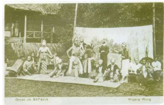
Gambar 5. Foto sampel “Wayang Orang”.

terhadap objek pemotretan. Pakaian sama-sama rapi namun sederhana. Tukang cukur rambut mengenakan peci sebagai penutup kepala. Jaket dengan model jas mendukung formalitas penampilan dalam merepresentasikan profesional yang menghormati pelanggannya. Meskipun demikian, dia tidak memakai alas kaki atau bertelanjang kaki. Sang pelanggan pun sama. Pakaian rapi dan tampak gesper ikat pinggang yang besar di perut. Biasanya gesper jenis ini dikenakan mereka yang memiliki kuasa atau wewenang terhadap sesuatu. Namun seperti tukang cukur, dia juga tidak mengenakan alas kaki. Tidak terlihat alas kaki satu pun di bawah mereka atau sekitarnya. Yang terlihat justru sapu lidi. Kemungkinan untuk menyapu lokasi mangkal sebelum salon dibuka maupun membersihkan lokasi dari rambut hasil cukur parapelanggan.