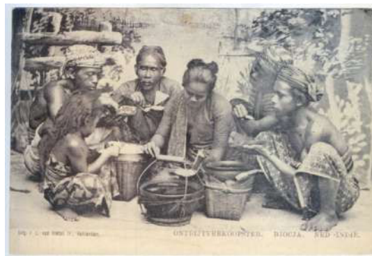
Gambar 2. Foto sampel “Penjual Nasi (2)”.

Foto sampel pertama adalah tentang penjual makanan untuk sarapan atau makan pada subjek-subjek imaji foto serta kebiasaan masyarakat Jawa, menunjukkan jika wadah-wadah tersebut berisi gudeg pada kualii di tengah. Sedangkan wakul besar berisi nasi, serta wakul kecil merupakan alas untuk kualii bubur nasi yang biasanya menjadi menu utama selain nasi.