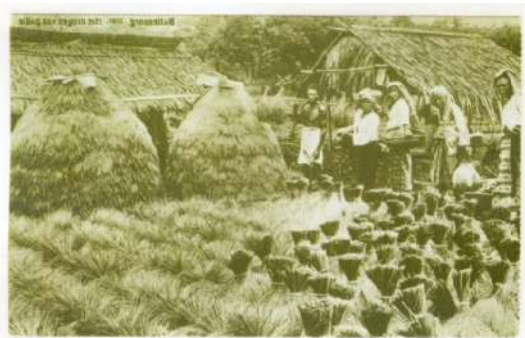
Gambar 6. Foto sampel “Menjemur Padi”.

ini berwarna hitam putih meskipun terlihat sudah agak berubah warna karena usia foto. Kontras warna masih cukup terlihat jelas. Pembingkai foto menggunakan format lebar sehingga subjek yang tertangkap kamera lebih luas. Subjek foto yang terbingkai terdiri dari para pemain wayang orang, latar belakang dekorasi, serta latar sekitar lokasi tempat pertunjukan digelar. “Panggung” digelar di atas tikar atau karpet memanjang. Pada latar belakang dipasang geber atau dekor bergambar pemandangan untuk menunjukkan bahwa mereka sedang melakukan suatu pertunjukan kesenian. Dekorasi dipasang hanya dengan dua bilah kayu/bambu tegak pada bagian kiri kanan- Raap (2013:115) menyebutkan dua batang pohon. Sementara di sekeliling mereka terbuka. Bahkan pada latar visual sebelah kiri tertangkap sosok wanita yang melihat dari beranda rumahnya. Panggung yang terbuka membuat penonton dapat menikmati pertunjukan dari berbagai sisi “panggung”.