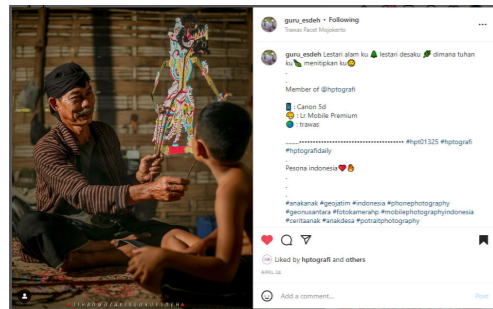
Gambar 4 Semiotika Foto 2 2022